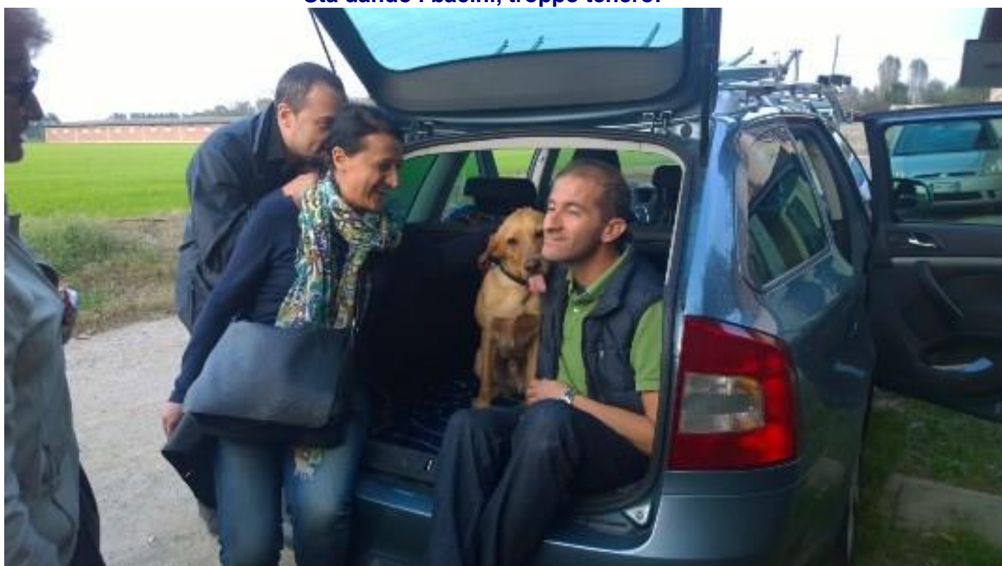
Ed ecco super monello a casa 😊