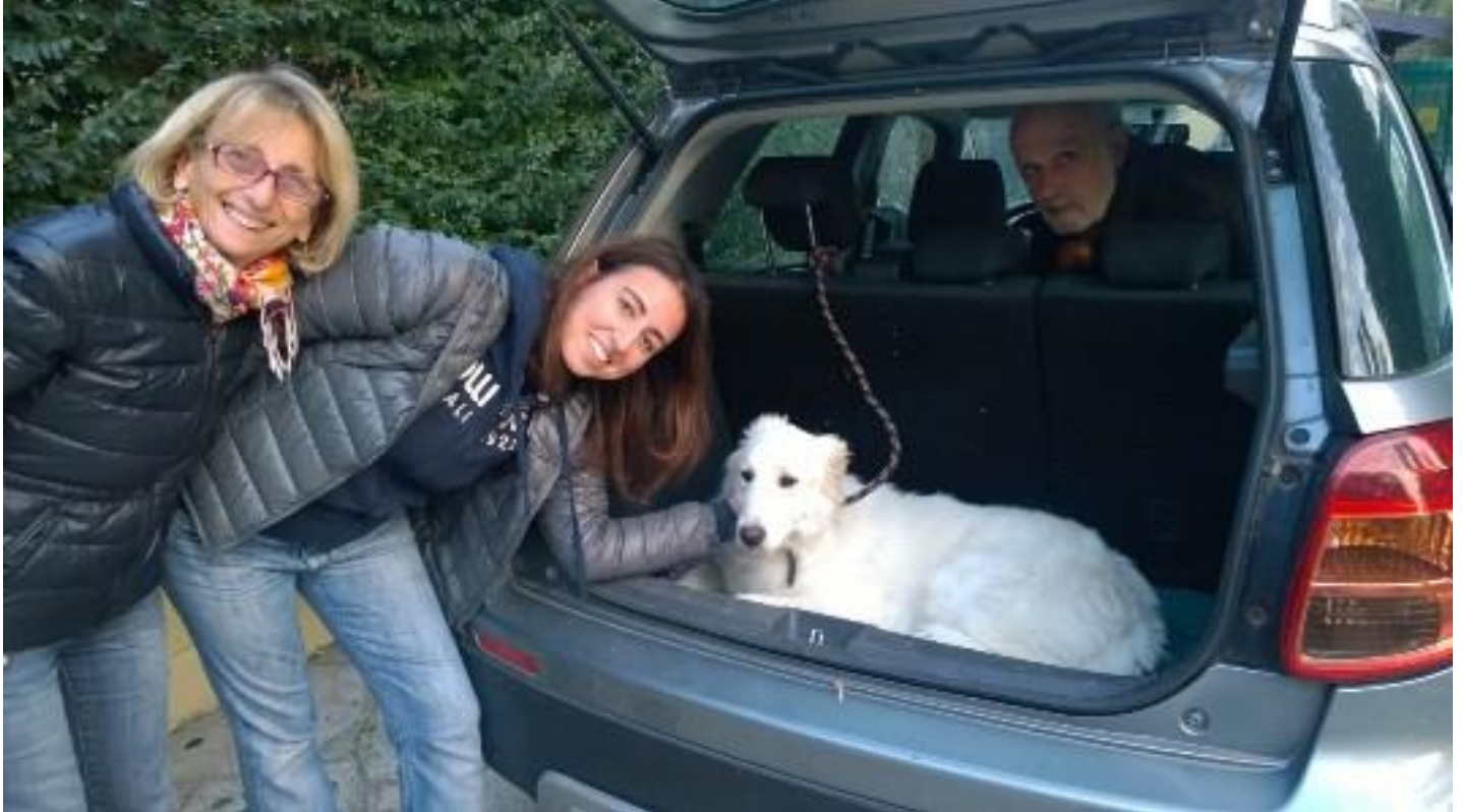
E anche Nuvola a CASA!!!!