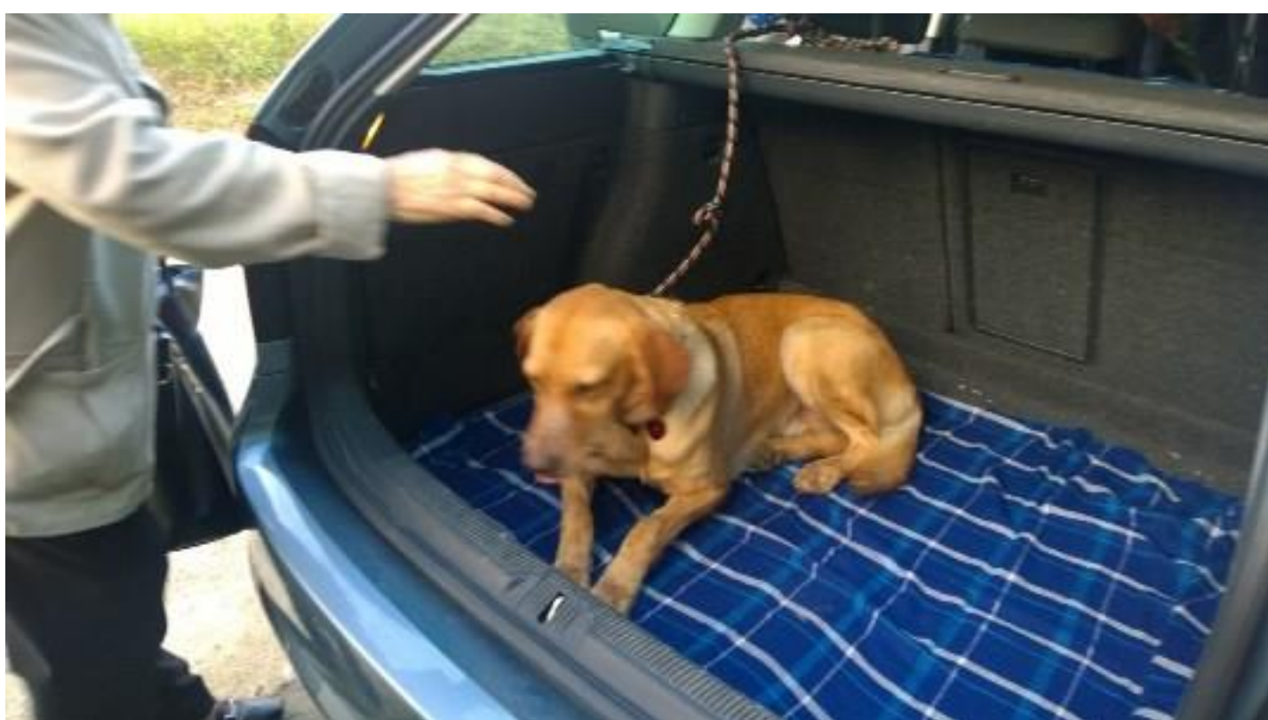
Sta dando i bacini, troppo tenero!